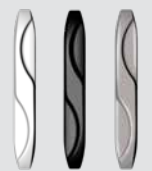
Poignée plate extérieure (Standard)