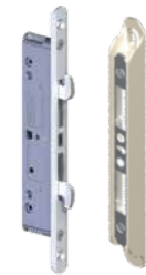
Barrure à mortaise et gâche ajustable

Système de barrure à mortaise double points en acier inoxydable et renforts d'acier insérés dans le meneau et le volet ouvrant pour permettre une résistance structurale supérieure.